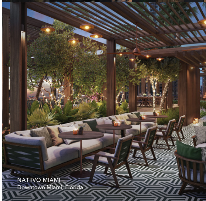
NATIIVO MIAMI Downtown Miami, Florida