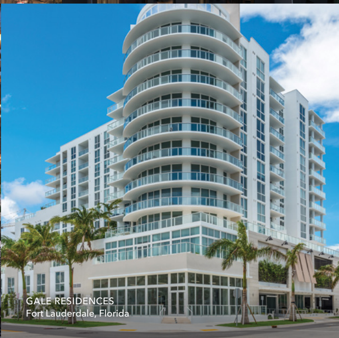
GALE RESIDENCES Fort Lauderdale, Florida