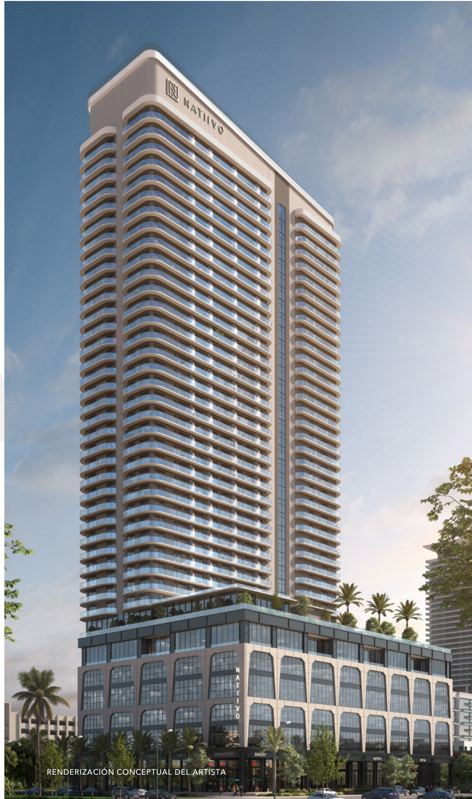
RENDERIZACIÓN CONCEPTUAL DEL ARTISTA

UBICACIÓN DEL EDIFICIO 200 West Broward Blvd. Fort Lauderdale, Florida 33311