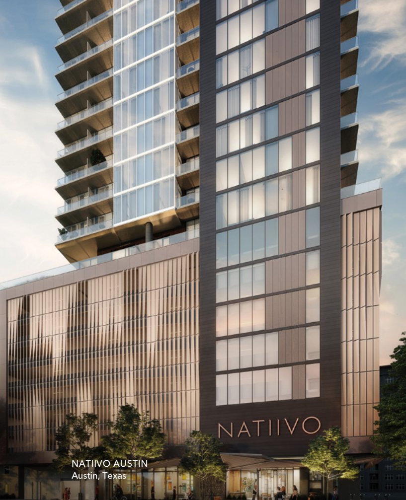
NATIIVO AUSTIN Austin, Texas