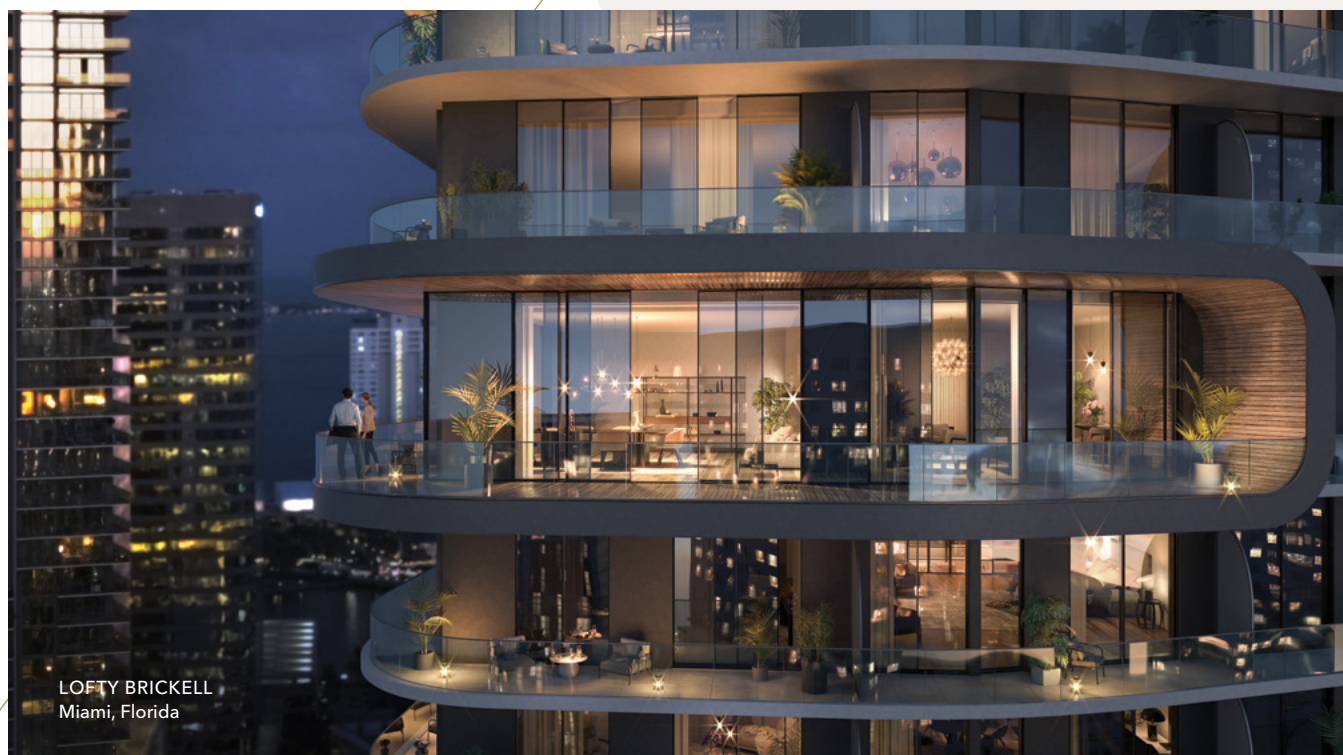
LOFTY BRICKELL Miami, Florida

UNA SELECCIÓN DE PROPIEDADES DESARROLLADAS POR NEWGARD