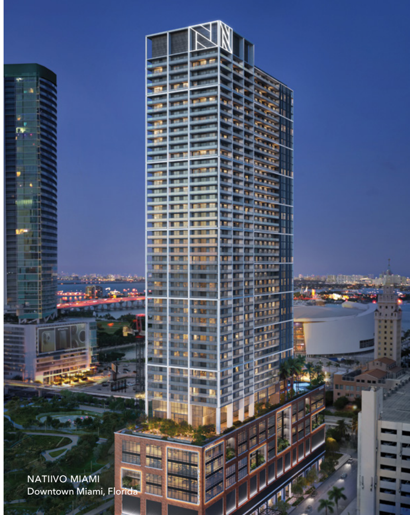
NATIIVO MIAMI Downtown Miami, Florida